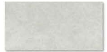
Cemento 31 x 62,5 cm

Pour votre piscine - skimmer ou à débordement - Rosa Gres vous offre en plus de la sécurité une infinité de combinaisons de formats, couleurs et matériaux.