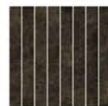
Ref. 310E1 Antracita 31 x 31 cm - 12" x 12"