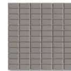
Ref. 323 ACERO / ACERO Anti-slip 32 x 32 x 0,5 cm