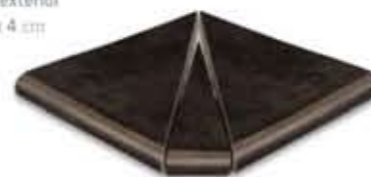
Ref. 346 Antracita anti-slip Esquina exterior 31 x 31 x 4 cm