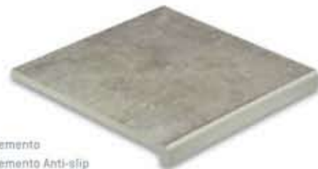
Ref. V31 Cemento Ref. V31 Cemento Anti-slip Vierteaguas 31 x 31 x 2,8 cm