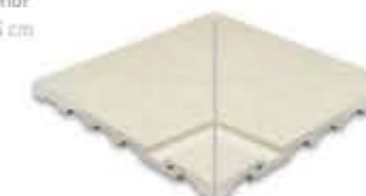
Ref. 354 Crema anti-slip Esquina interior 31 x 31 x 2,6 cm