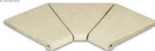
Ref. 343 Crema anti-slip Esquina interior