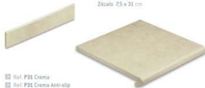
Ref. P31 Crema Ref. P31 Crema Anti-slip Peldaño 31 x 32,3 x 3,8 cm