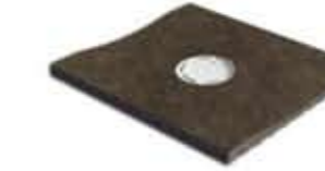
Ref. 368 Antracita Canaleta Anti-slip 14,2 x 31 x 2,4 cm