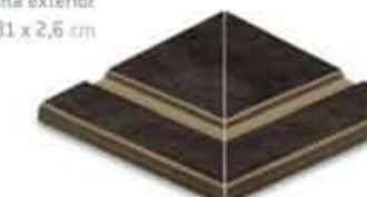
Ref. 365 Antracita anti-slip Esquina exterior 31 x 31 x 2,6 cm