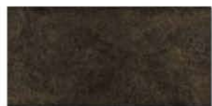
Ref. 316 Antracita 31 x 62,6 cm - 12" x 24"