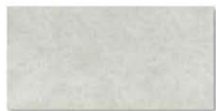
Cemento 31 x 62,5 cm