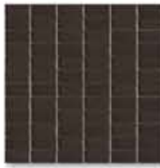
Mosaico Plomo 32 x 32 cm

MOSAICO PORCELÁNICO Acabado: Liso / Anti-slip Malla: 32 x 32 cm - 12" x 12" Piezas: 2,5 x 5 cm - 1" x 2"