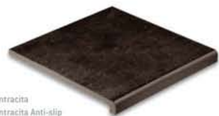
Ref. V31 Antracita Ref. V31 Antracita Anti-slip Vierteaguas 31 x 31 x 2,8 cm