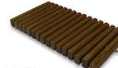
Ref. 985* 24,5 x 50 x 3,8 cm