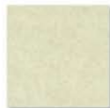
Ref. 310 Crema 31 x 31 cm - 12" x 12"