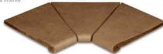
Ref. 343 Cacao anti-slip Esquina interior