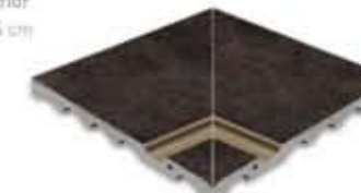
Ref. 364 Antracita anti-slip Esquina interior 31 x 31 x 2,6 cm