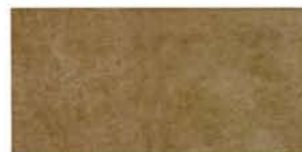
Ref. 316 Cacao Anti-slip 31 x 62,6 cm - 12" x 24"