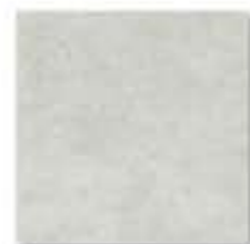
Ref. 310 Cemento Anti-slip 31 x 31 cm - 12" x 12"