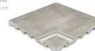
Ref. 364 Cemento anti-slip Esquina interior 31 x 31 x 2,6 cm