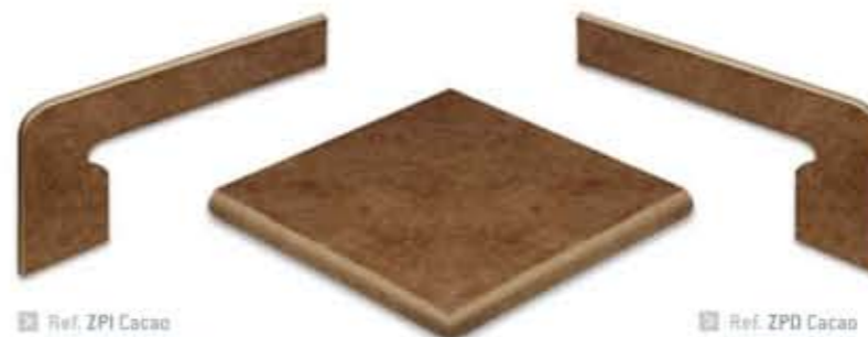
Ref. ZPI Cacao Zanquín izquierdo 19,2 x 38,7 x 7 cm