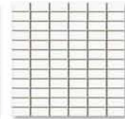
Mosaico Satén 32 x 32 cm