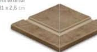
Ref. 365 Cacao anti-slip Esquina exterior 31 x 31 x 2,6 cm