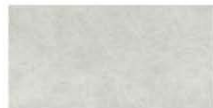
Ref. 316 Cemento Anti-slip 31 x 62,6 cm - 12" x 24"