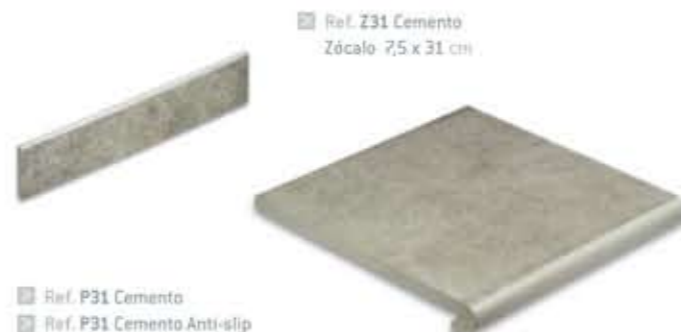
Ref. P31 Cemento Ref. P31 Cemento Anti-slip Peldaño 31 x 32,3 x 3,8 cm