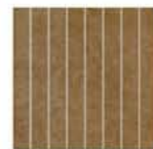
Ref. 310E1 Cacao 31 x 31 cm - 12" x 12"