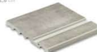
Ref. 347 Cemento anti-slip 31 x 31 x 2,6 cm