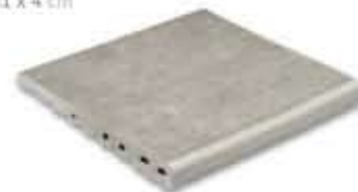
Ref. 348 Cemento anti-slip 31 x 31 x 4 cm