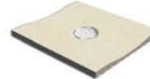
Ref. 368 Crema Canaleta Anti-slip 14,2 x 31 x 2,4 cm