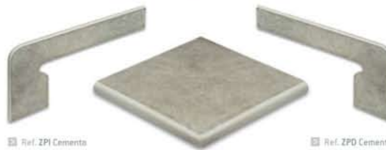
Ref. ZPI Cemento Zanquín izquierdo 19,2 x 38,7 x 7 cm