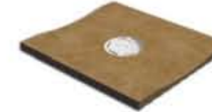
Ref. 368 Cacao Canaleta Anti-slip 14,2 x 31 x 2,4 cm