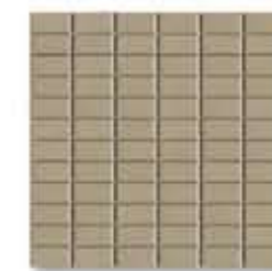
Ref. 323 CAMEL / CAMEL Anti-slip 32 x 32 x 0,5 cm