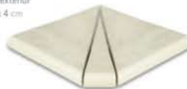
Ref. 346 Crema anti-slip Esquina exterior 31 x 31 x 4 cm