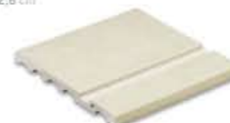
Ref. 347 Crema anti-slip 31 x 31 x 2,6 cm