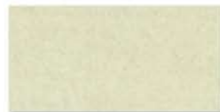
Ref. 316 Crema Anti-slip 31 x 62,6 cm - 12" x 24"