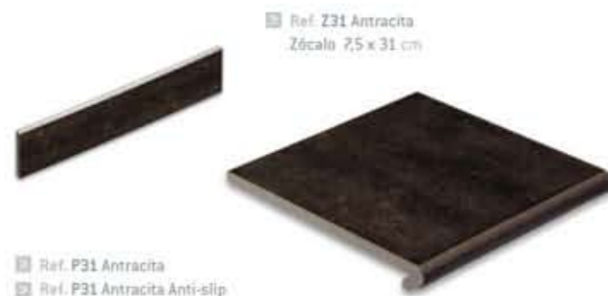
Ref. P31 Antracita Ref. P31 Antracita Anti-slip Peldaño 31 x 32,3 x 3,8 cm