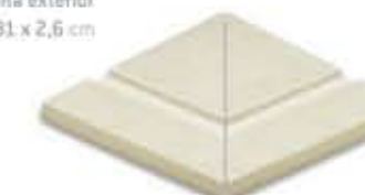
Ref. 365 Crema anti-slip Esquina exterior 31 x 31 x 2,6 cm