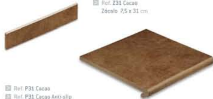
Ref. P31 Cacao Ref. P31 Cacao Anti-slip Peldaño 31 x 32,3 x 3,8 cm