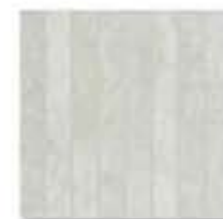
Ref. 310E1 Cemento 31 x 31 cm - 12" x 12"