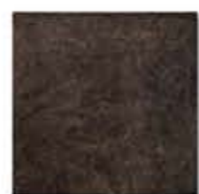
Ref. 310 Antracita Anti-slip 31 x 31 cm - 12" x 12"