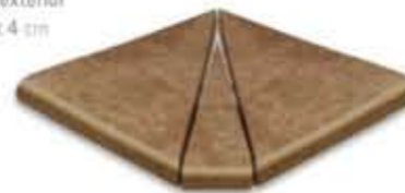
Ref. 346 Cacao anti-slip Esquina exterior 31 x 31 x 4 cm