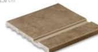
Ref. 347 Cacao anti-slip 31 x 31 x 2,6 cm