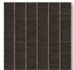
Mosaico PLOMO 32 x 32 cm