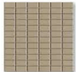
Mosaico CAMEL 32 x 32 cm