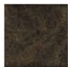
Ref. 310 Antracita 31 x 31 cm - 12" x 12"