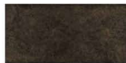
Ref. 316 Antracita Anti-slip 31 x 62,6 cm - 12" x 24"