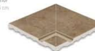
Ref. 364 Cacao anti-slip Esquina interior 31 x 31 x 2,6 cm