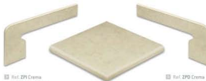
Ref. ZPI Crema Zanquín izquierdo 19,2 x 38,7 x 7 cm