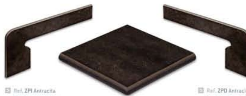
Ref. ZPI Antracita Zanquín izquierdo 19,2 x 38,7 x 7 cm