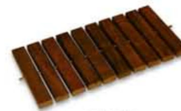
Ref. 986 24,5 x 50 x 2,2 cm