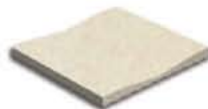
Ref. 367 Crema Canaleta Anti-slip 14,2 x 31 x 2,4 cm