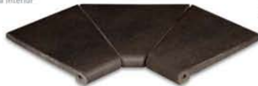
Ref. 343 Antracita anti-slip Esquina interior