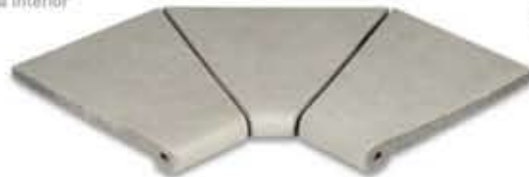
Ref. 343 Cemento anti-slip Esquina interior