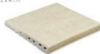
Ref. 348 Crema anti-slip 31 x 31 x 4 cm