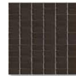
Ref. 323 PLOMO / PLOMO Anti-slip 32 x 32 x 0,5 cm