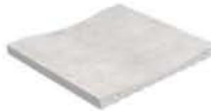
Ref. 367 Cemento Canaleta Anti-slip 14,2 x 31 x 2,4 cm