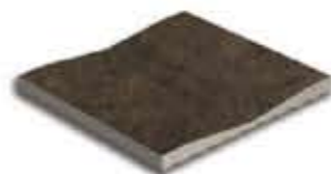
Ref. 367 Antracita Canaleta Anti-slip 14,2 x 31 x 2,4 cm