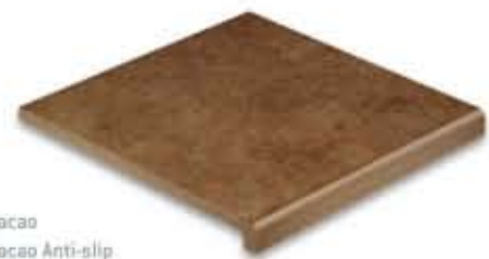
Ref. V31 Cacao Ref. V31 Cacao Anti-slip Vierteaguas 31 x 31 x 2,8 cm