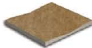
Ref. 367 Cacao Canaleta Anti-slip 14,2 x 31 x 2,4 cm