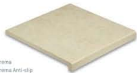
Ref. V31 Crema Ref. V31 Crema Anti-slip Vierteaguas 31 x 31 x 2,8 cm