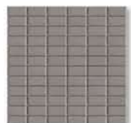
Mosaico ACERO 32 x 32 cm