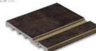
Ref. 347 Antracita anti-slip 31 x 31 x 2,6 cm