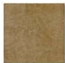
Ref. 310 Cacao 31 x 31 cm - 12" x 12"