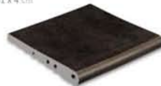
Ref. 348 Antracita anti-slip 31 x 31 x 4 cm