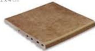
Ref. 348 Cacao anti-slip 31 x 31 x 4 cm