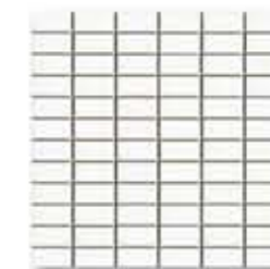
Ref. 323 SATÉN / SATÉN Anti-slip 32 x 32 x 0,5 cm