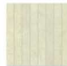
Ref. 310E1 Crema 31 x 31 cm - 12" x 12"