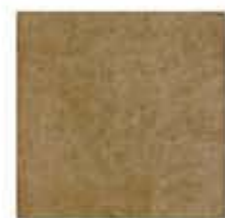
Ref. 310 Cacao Anti-slip 31 x 31 cm - 12" x 12"