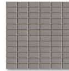
Mosaico Acero 32 x 32 cm

MOSAÏQUE Mosaïque de grès cérame. Pièces de format 2,5 x 5. Disponible dans 4 couleurs : Satén, Acero, Caramel, Plomo et 2 finitions : lisse et antidérapant.